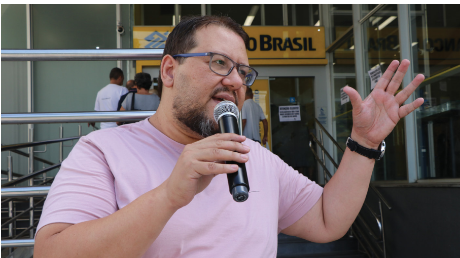
Em 18 de março, o Sindicato realizou um protesto na agência da Rua Rui Barbosa contra o fechamento dos caixas. Como já vinha acontecendo, a unidade apresentava filas extensas, e os clientes reagiram com indignação diante da notícia do encerramento do atendimento nos caixas

O Sindicato aguarda uma decisão favorável aos trabalhadores. Tudo indica que essa manobra do Banco do Brasil para enxugar a estrutura da agência Rui Barbosa não passa de um movimento calculado, com o verdadeiro objetivo de pavimentar o caminho para seu fechamento. Ou seja, mais uma “reorganização” que só penaliza funcionários e enfraquece o atendimento à população. Inadmissível!