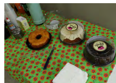
Sindicato ofereceu café da manhã especial aos 56 bancários de Bauru, Agudos e Duartina, beneficiados pelo acordo de “quebra de caixa”