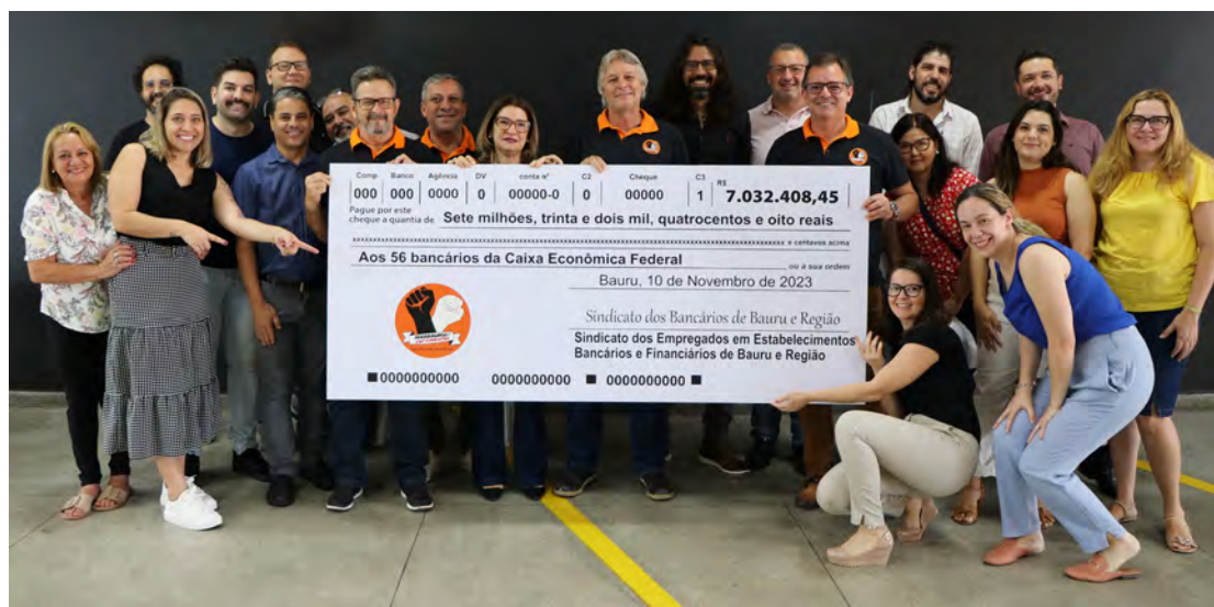
Essa conquista é nossa, bancários! Empregados da CEF, diretores e funcionários do Sindicato comemoram acordo

A data de pagamento será divulgada nos meios de comunicação do Sindicato. Fiquem atentos!