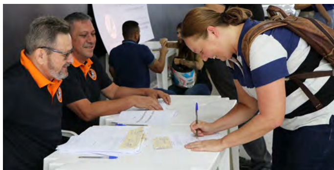
O verdadeiro sextou! Cheques foram entregues em plena sexta-feira