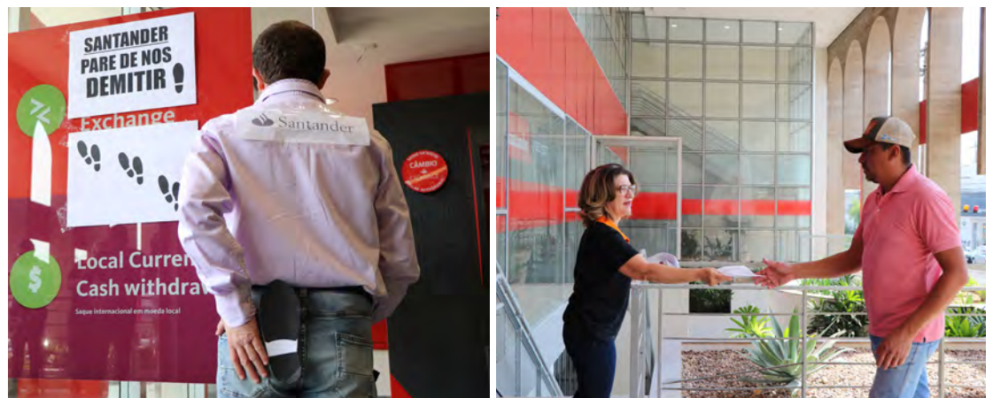
Clientes receberam panfleto explicativo sobre o protesto e apoiaram o Sindicato. Até julho deste ano, o Santander Brasil contabilizava 63,3 milhões de clientes, 1.636 agências e 55.17 funcionários. Ou seja, o número de funcionários do banco ainda é mínimo, diante da quantidade de serviço

Depois de tantos anos do Santander divulgando essa pergunta em campanhas publicitárias nos principais canais de TV e outros meios, o Sindicato resolveu respondê-la!