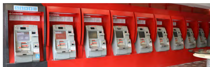
Agência 0004 passou por reforma nos últimos dias. Mais de 5 caixas eletrônicos foram retirados. Medida irá prejudicar clientes, que terão que enfrentar mais filas por conta da quantidade reduzida de máquinas