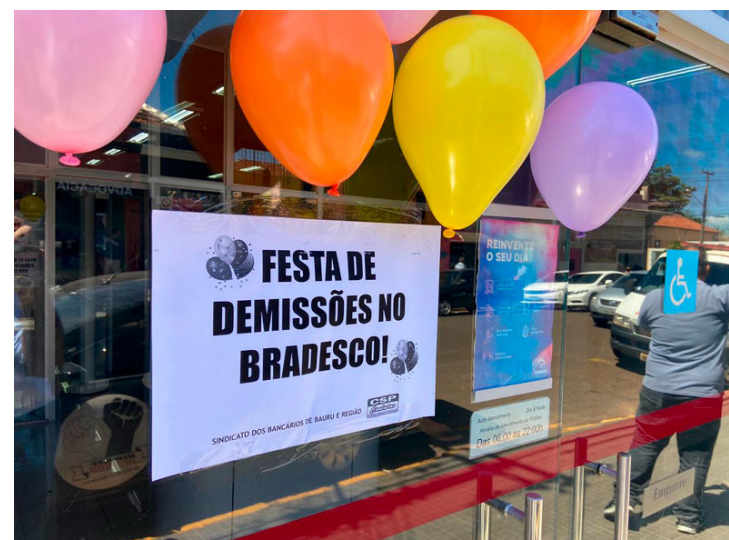
Sindicato promoveu protesto denunciando a festa de demissões promovidas pelo Bradesco: mais de 50 em dois anos de pandemia

IMUNIZAÇÃO - A Campanha de Vacinação Contra Gripe na categoria bancária teve início no último dia 25. O imunizante aplicado será o Quadrivalente, que protege contra quatro formas do vírus Influenza: o H1N1 e H3N2, da cepa A, e Victoria e Yamagata, da cepa B. Neste ano, 19 bancos participam da campanha e cerca de 370 mil trabalhadores de todo o país deverão ser atendidos. A aplicação ocorrerá nos próprios locais de trabalho, em sistema drive-thru, ou ainda em clínicas credenciadas. A influenza é uma infecção viral com potencial pandêmico e pode levar a quadros de doenças que variam de leves a graves, podendo ser fatal. Por isso, a vacinação é fundamental no combate ao vírus, minimizando sua carga e reduzindo os sintomas, que também podem ser confundidos com os da Covid-19. O Sindicato dos Bancários de Bauru e Região apoia e incentiva a vacinação. Proteja-se!