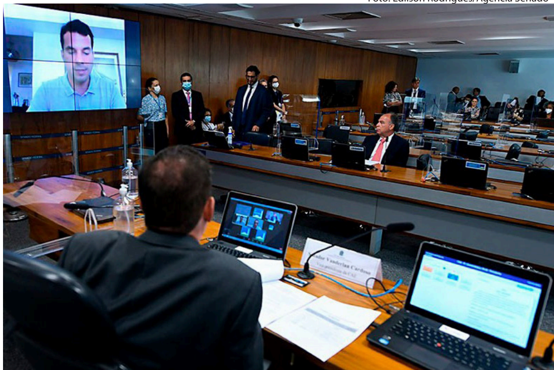
Vitória dos trabalhadores: senadores corrigem injustiça histórica e aprovam fim de cobrança de Imposto de Renda sobre Participação nos Lucros ou Resultados (PLR)