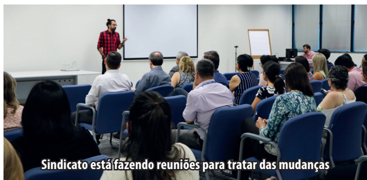
Sindicato está fazendo reuniões para tratar das mudanças

Diante da falta de informações sobre a já anunciada reestruturação da Caixa, bem como da ausência de negociação com o movimento sindical, os empregados do banco estão apreensivos.